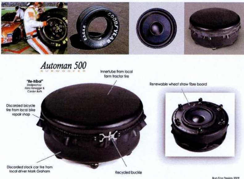
Bon Eco Design 2009

来自加拿大Bon ECO设计团队的轮胎音响设计得到了很多网民的选票,它其实是采用回收的轮胎来手工制作的,每个音响的主体是一个汽车轮胎,其余的附件则来自于回收的自行车轮胎和拖拉机内胎等。它不仅表达出“用轮胎来做音响”的可能性,事实上,轮胎橡胶加强了共振效果,让低音更加厚实和富有感染力,用在家庭影院当中可以发出极为美妙和富于特点的声音。